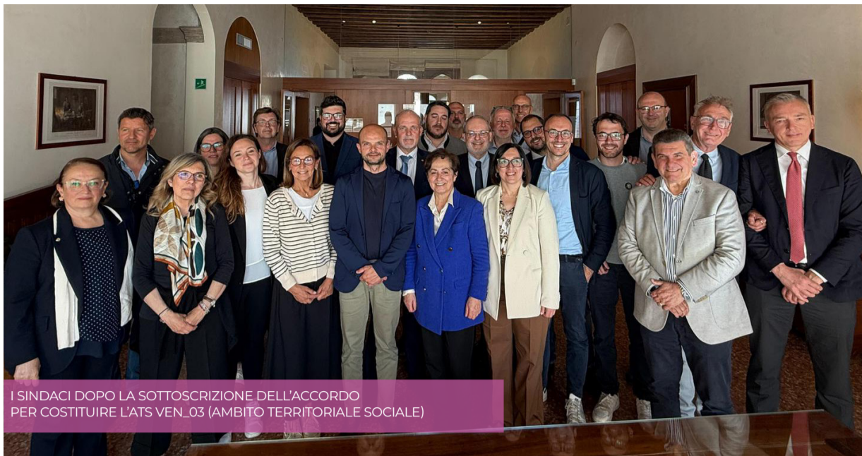
I SINDACI DOPO LA SOTTOSCRIZIONE DELL'ACCORDO PER COSTITUIRE L'ATS VEN_03 (AMBITO TERRITORIALE SOCIALE)